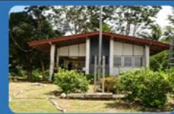
ด่านตรวจศุลกากรเกาะตรุเตา

ร่วมด้วยช่วยกันปลูกต้นไม้หลากหลายสายพันธุ์ อาทิ ต้นกาหลง ต้นมะขาม ต้นมะฮอกกานี ต้นพะยุง และต้นตำเสา รวมทั้งสิ้น ๓๕๐ ต้น โดยขอรับการสนับสนุนกล้าไม้จากสำนักจัดการทรัพยากรป่าไม้ที่ ๑๓ (สงขลา) กรมป่าไม้