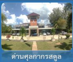
ด่านศุลกากรสตูล