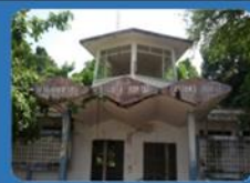
ด่านศุลกากรเกาะยาว