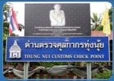
ด่านตรวจศุลกากรทุ่งนุ้ย