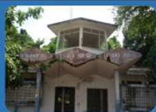
ด่านศุลกากรเกาะยาว