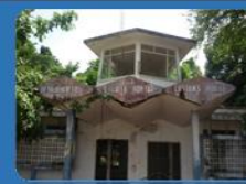
ด่านศุลกากรเกาะยาว