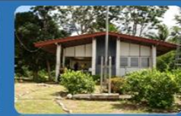
ด่านตรวจศุลกากรเกาะตงเตา