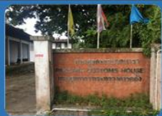
ด่านศุลกากรปากบารา