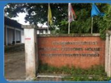
ด่านศุลกากรปากบารา