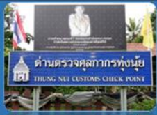
ด่านตรวจศุลกากรทุ่งน้ย