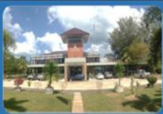
ด่านศุลกากรสตูล