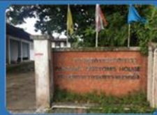
ด่านศุลกากรปากบารา