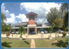
ด่านศุลกากรสตูล