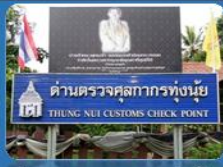
ด่านตรวจศุลกากรทุ่งนุ้ย